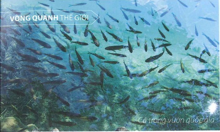
Cá trong vườn quốc gia